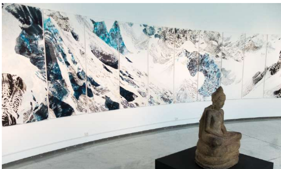
Caribai, Vue de l'exposition au musée des Arts Asiatiques de Nice

2019 Espace muséal, Mairie-Château de Tourettes-sur-Loup, France