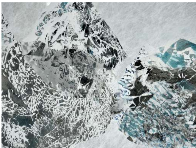
Cariba , Monde flottant d tail

Ce monde min ral qui offre tout un univers de strates et de stries comme autant de signes de l' criture du temps, est une mine sans fond d'o  extraire d'infinies variations de formes.