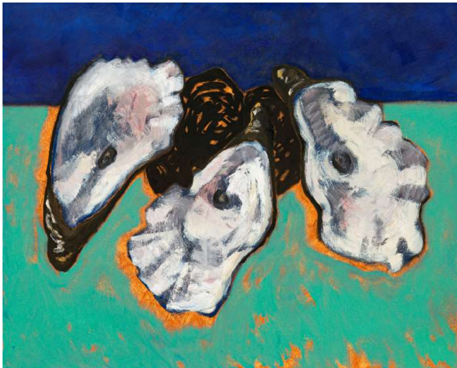
Guy de Malherbe , Relief : Trois huitres, huile sur toile 81 x 100 cm, 2020