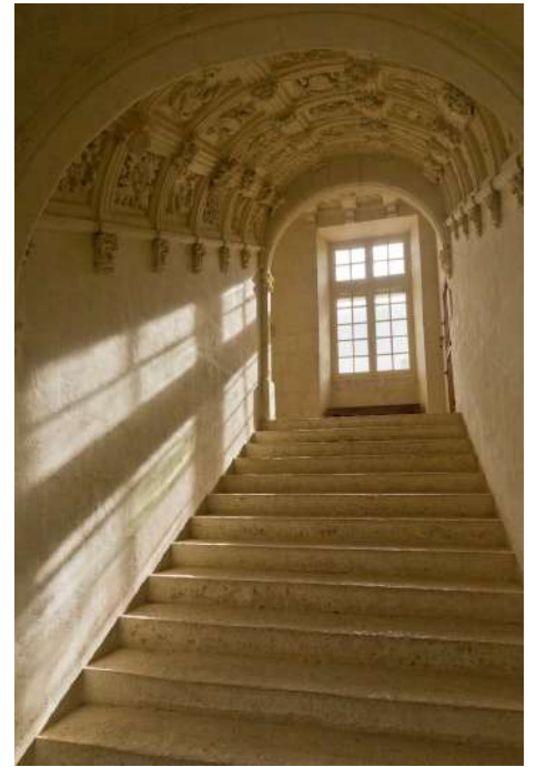
L'escalier à caissons Renaissance

Le jardin, classé "Jardin Remarquable", se compose d'un parterre à la française au tracé symétrique. Il est bordé d'un labyrinthe de charmilles, en son centre trône un platane séculaire. A l'arrière du château, un jardin à l'italienne fut créé en 1930 .