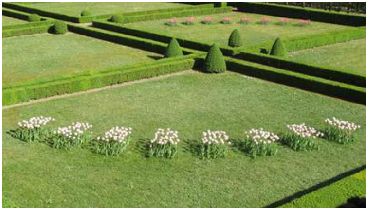
Les jardins à la française

L'escalier à caissons Renaissance est l'un des plus remarquables répertorié en France. Ses voûtes entièrement sculptées, rassemblent plus de 160 motifs allégoriques, mythologiques, héraldiques comme la célèbre salamandre de François I er .