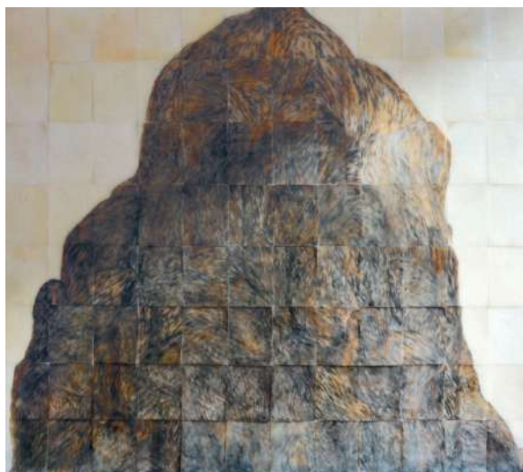
Val rie Novello, Tas, cire / gravure, 240 x 264 x 1 cm, 2017