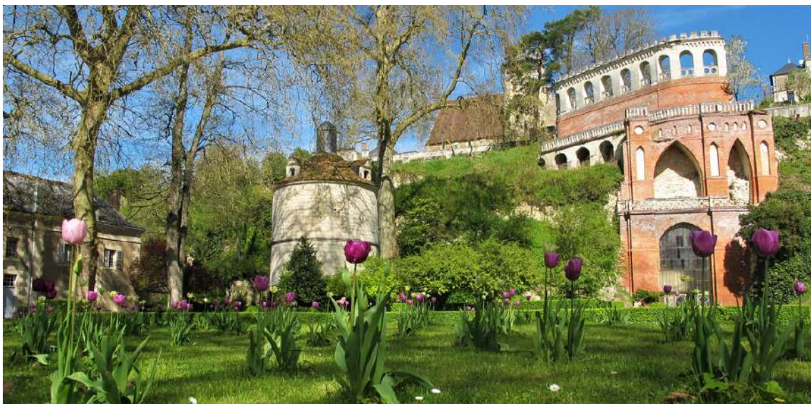
Les jardins avec le pigeonnier du XVI ème siècle et la folie néogothique de 1830

Enfin, surplombant les jardins, la Terrasse Caroline offre un impressionnant décor de briques et de pierres. Telle une ruine, elle célèbre le goût néogothique des années 1830.