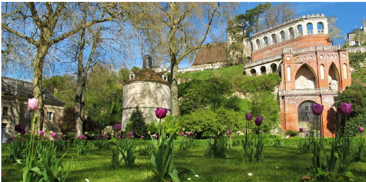
Les jardins avec le pigeonnier du XVI ème siècle et la folie néogothique de 1830

Enfin, surplombant les jardins, la Terrasse Caroline offre un impressionnant décor de briques et de pierres. Telle une ruine, elle célèbre le goût néogothique des années 1830.