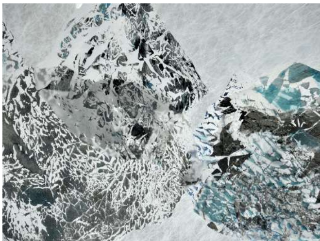
Cariba  , Monde flottant d tail

Ce monde min ral qui offre tout un univers de strates et de stries comme autant de signes de l' criture du temps, est une mine sans fond d'o  extraire d'infinies variations de formes.