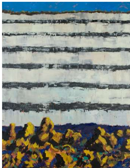
Guy de Malherbe , Falaise , huile sur toile, 250 X 200 cm, 2013