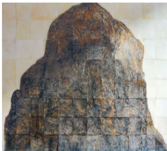
Val rie Novello , Tas , cire / gravure, 240 x 264 x 1 cm, 2017